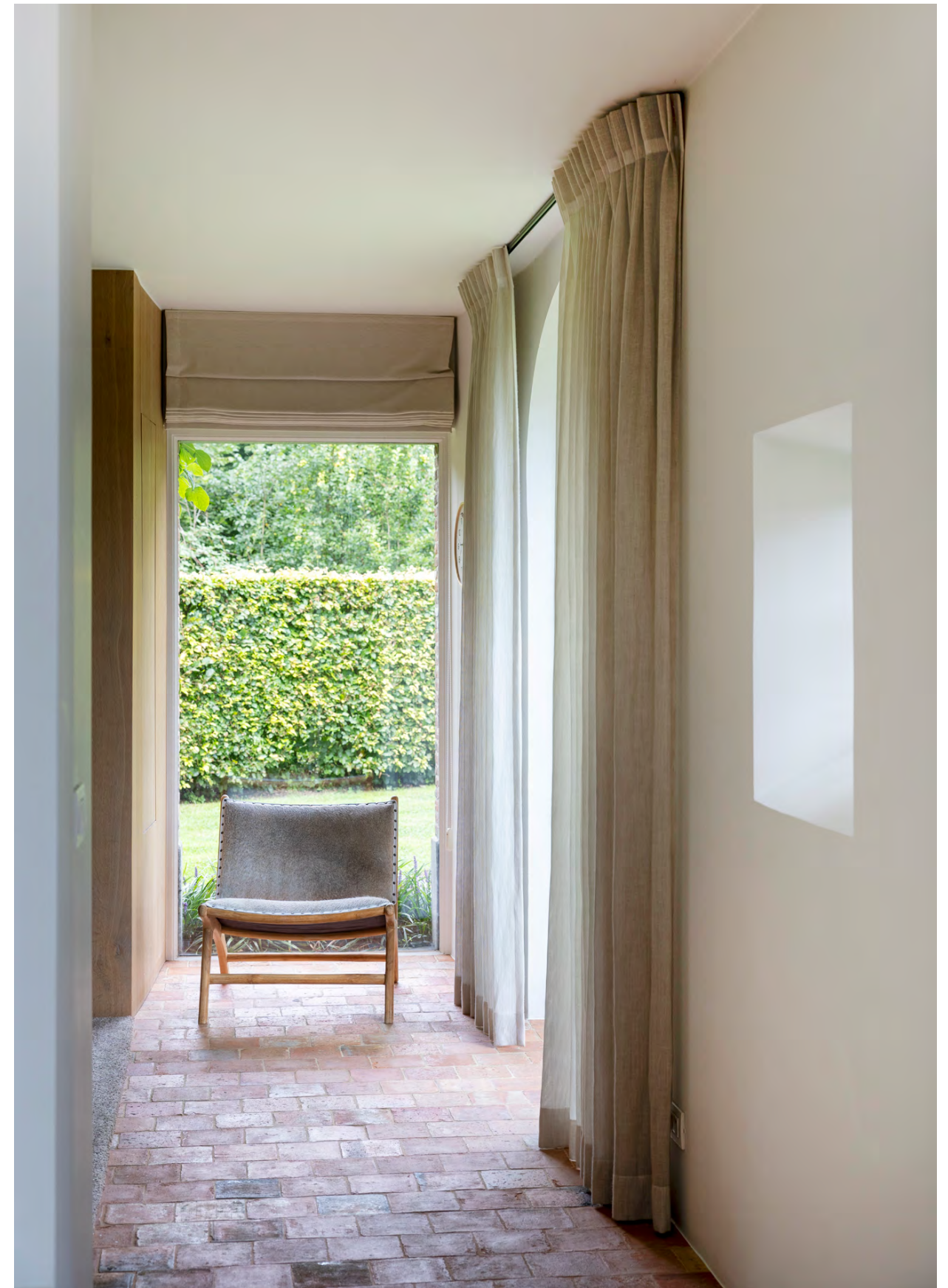
De gordijnen in het huis zijn op maat gemaakt door Benedetti Interieur.