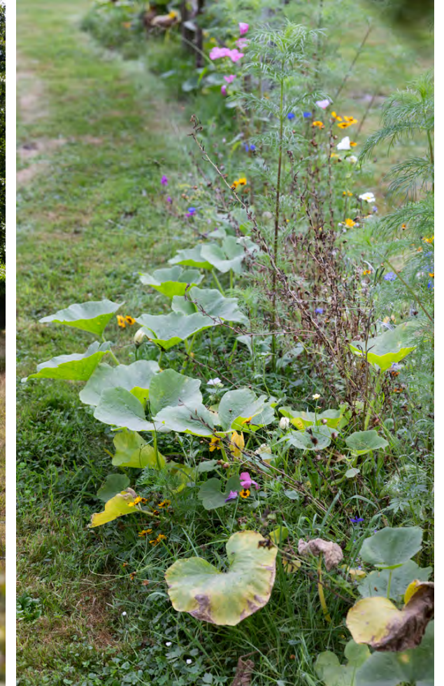
Na een drukke dag komt Toon helemaal tot rust in de tuin, waar hij zelf graag in bezig is. Tuinieren is voor hem een manier om te ontspannen.